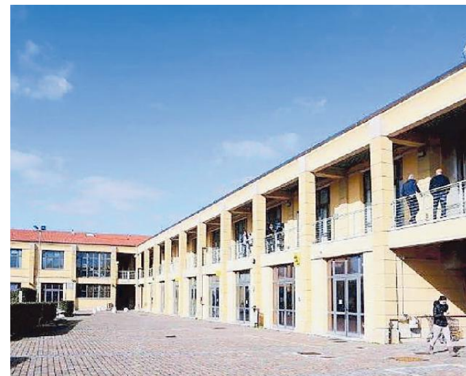
La sede del Polo Tecnologico di Navacchio